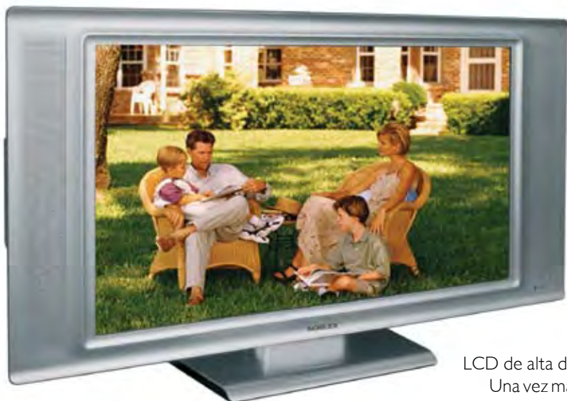
LCD de alta definición.

La buena imagen lograda durante más de 70 años en el mercado nacional, el mantenimiento de su nivel de calidad, su amplia y eficiente red de distribución comercial y servicios técnicos, sostiene e incrementa el éxito en el lanzamiento de sus nuevos productos.