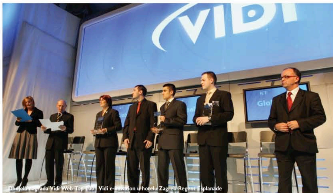
Dodjela nagrada Vidi Web Top 100 i Vidi e-novation u hotelu Zagreb Regent Esplanade

Tiskani proizvodi Vidija nastali su u vrijeme kada su računala i internet bili rezervirani isključivo za stručne krugove - većinom studente elektrotehničkih i strojarških fakulteta ili stručnih škola. U tim vremenima razvijen je i temelj prepoznatljivosti Vidijevih proizvoda - inženjerski pristup temama, kvaliteta sadržaja temeljena na stručnim, opsežnim i nepristranim testovima. Ovaj pobjednički koncept cijenjen je kod čitatelja Vidijevih izdanja i danas kada su visokotehnološke teme i hi-tech uređaji zanimljivi širokom populacijskom krugu. U poplavi "šarenog" potrošačkog sadržaja, pokazalo se kako kupci koji kupuju informatičku i telekomunikacijsku opremu u pravilu traže egzaktnu, nepristranu i provjerenu informaciju koja će ih jasno uputiti koji uređaj, softver ili uslugu vrijedi kupiti ili koristiti. Takav provjeren i nerijetko ekskluzivan sadržaj u tekstu, slici i videu nude upravo proizvodi izdavačke kuće Vidi.