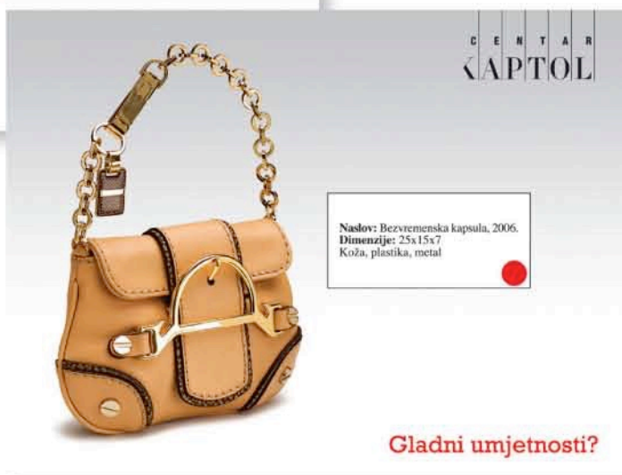
Naslov: Bezvremenska kapsula, 2006. Dimenzije: 25x15x7 Koža, plastika, metal

Osim proslavama svojih rođendana na Valentinovo, Centar Kaptol se u javnosti proslavio još jednom vrstom evenata. Riječ je o Dugim četvrtcima. Koncept koji obuhvaća produljenje radnog vremena četvrtkom do 23 sata i pružanje dodatnog sadržaja koji privlači posjetitelje, pokazao se toliko uspješnim da su ga preuzele i