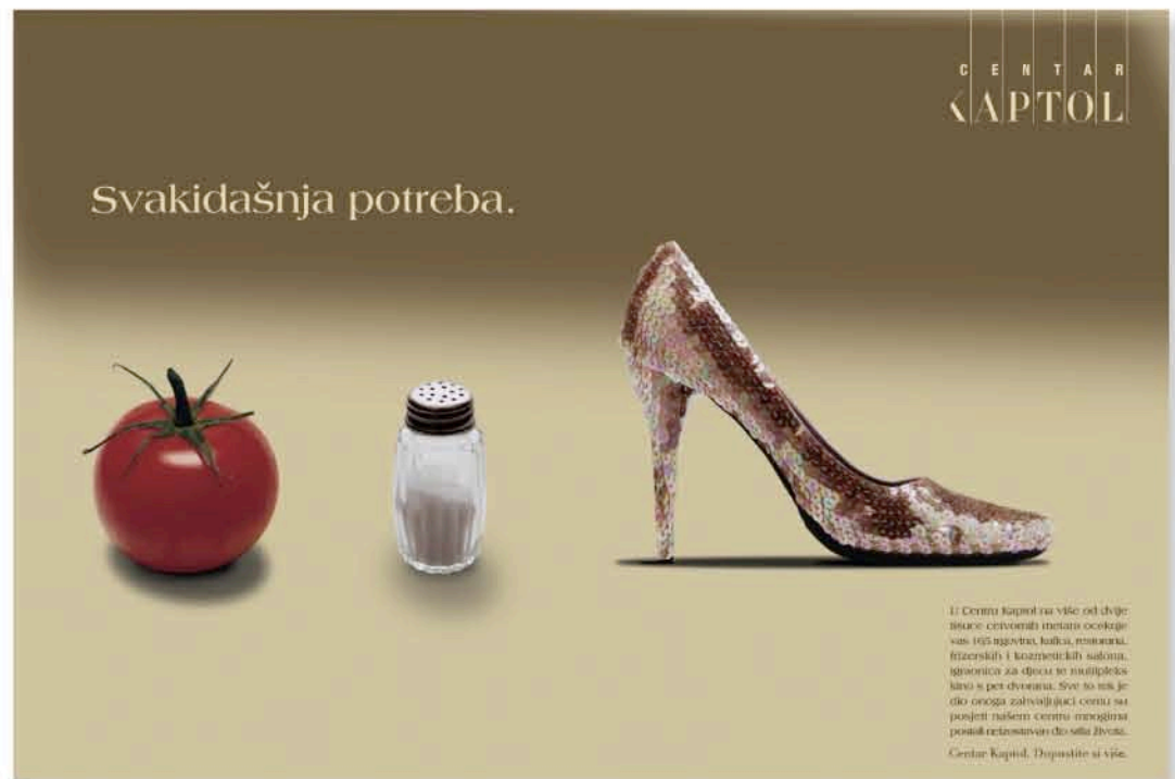
U Centru Kaptol na više od dvije tisuće centimih metara okružuje vas 100 trgovina, kafića, muzeja, fitnessa i kozmetičkih salona. Ispitajte za dvije se minute koliko je dio onoga zahvaljujući Centru na posjet našem centru mnogima postali retostima u vašem životu. Centar Kaptol. Dopustite si više.